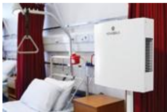
Soba za pacijente