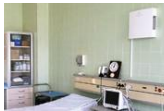
Soba za intenzivnu njegu